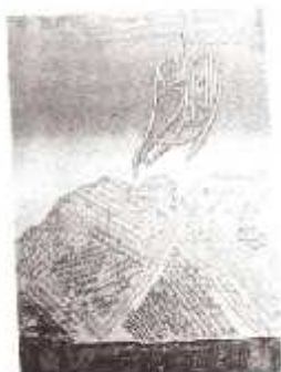
Gambar 9. Lukisan Kaligrafi hasil karya Tubagus Dudum Sonjaya

Karya-karya pelukis terkenal seperti A. Sadali, A.D. Pirous dan Amri Yahya dengan kekhususan tekniknya masing-masing mampu mencuatkan nilai baru dalam seni kaligrafi Islam di Indonesia. Huruf Arab yang hadir pada karya-karya mereka menjadi unsur yang lebur dalam ungkapan seni, unsur-unsur garis, bentuk dan warna hadir sebagai media ekspresi (Wiyoso Yudoseputro, 1986: 157). Secara fisik karya lukisan seniman tersebut sering disebut kaligrafi bebas, meleburkan berbagai unsur seni rupa secara utuh dan menyatu sebagai lukisan.