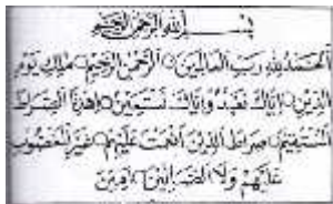
Gambar. 1 Lukisan Kaligrafi Oleh A.D. Pirous,

Tulisan Naskhi membawa pengaruh positif terhadap penulisan mushaf Al-Qur'an, yakni digunakan sebagai penulisan Al Qur'an di berbagai Negara termasuk Indonesia serta dipakai dalam penulisan naskah-naskah ilmiah Arab.